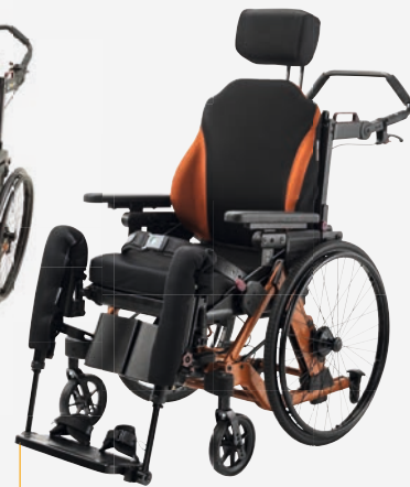
Netti Dynamic AdaptPro