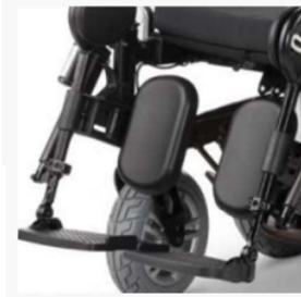
Electrically adjustable legrest available as an option