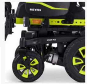
Castor wheels with aluminium rim