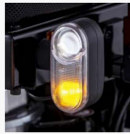
Active LED lighting