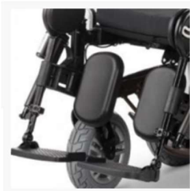
Electrically adjustable legrest available as an option