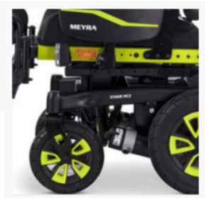
Castor wheels with aluminium rim

MEYRA ITALY SRL – Sede operativa: via Provinciale 6/A – 23843 Dolzago; mail: mit.info@meyragroup.com