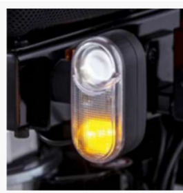
Active LED lighting