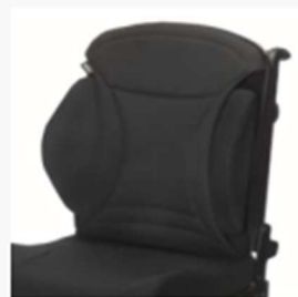
Various optional seating systems