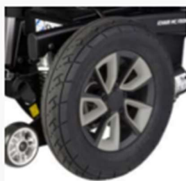
14" drive wheels front