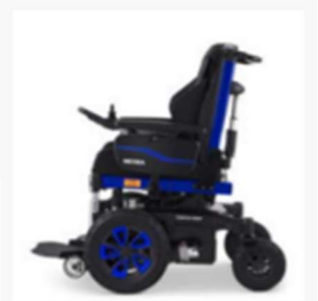
High degree of manoeuvrability due to compact dimensions