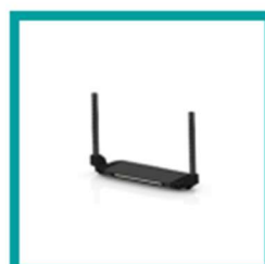
15 Code 4312