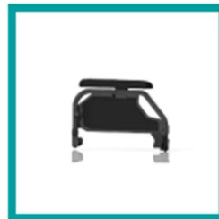
14 Code 107