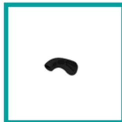
10 Code 413