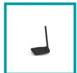
15 Code 798