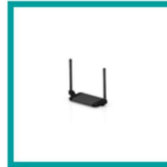
15 Code 54