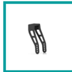
00 Code 174