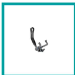
08 Code 650