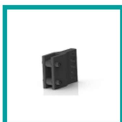
03 Code 880