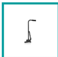
10 Code 4212