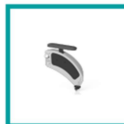
14 Code 748