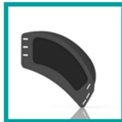
14 Code 98