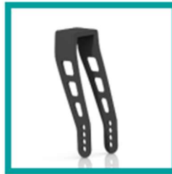
00 Code 418