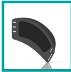
14 Code 98