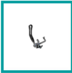
08 Code 650