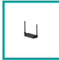
15 Code 54