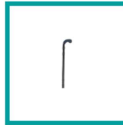
10 Code 621