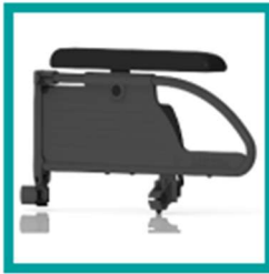
14 Code 21