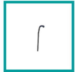
10 Code 622