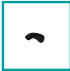
10 Code 413