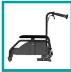
10 Code 26