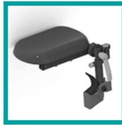
15 Code 52