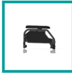
14 Code 107