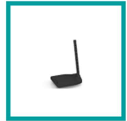
15 Code 798