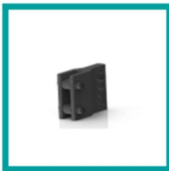
03 Code 880