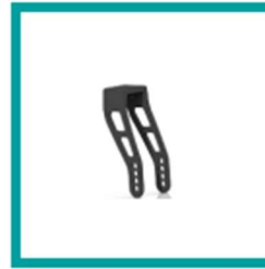
00 Code 174