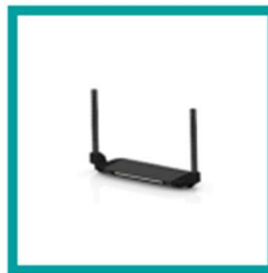
15 Code 4312