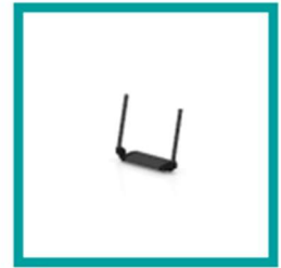
15 Code 87