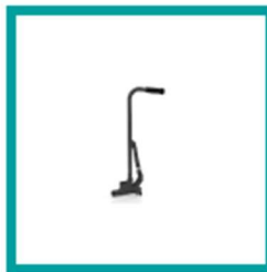
10 Code 4212