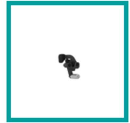
08 Code 305