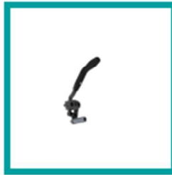
08 Code 681