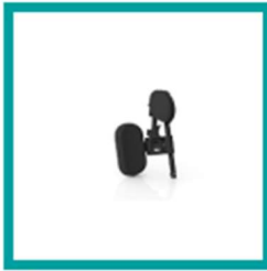
15 Code 92