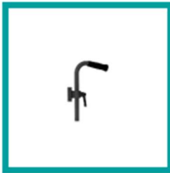
10 Code 410