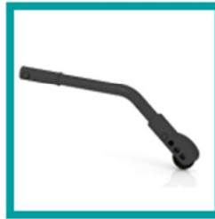
19 Code 691